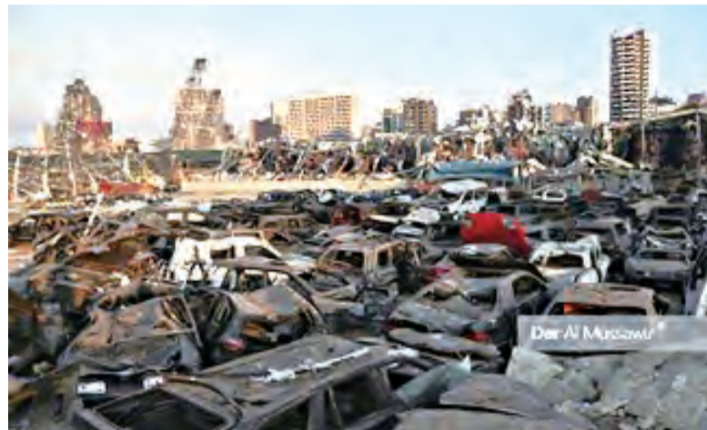
▲黎巴嫩原本存在的饑荒及食安問題，加上滿目瘡痍的爆炸慘況，亟待救援。 ▲貝魯特港區大爆炸，國際間已召開視訊峰會，承諾募集資源，協助黎巴嫩災後重建。