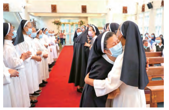
▲全體修女以傳統的友愛禮歡迎宣發終身願及歡度金銀慶的姊妹。