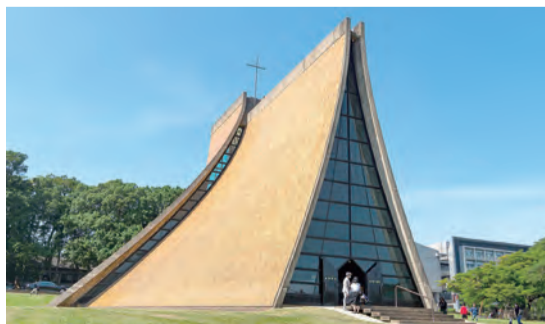
▲貝聿銘於1963年所設計的東海大學路思義教堂。 ◀建於1506至1626年的梵蒂岡聖伯多祿大殿，已成為天主教會重要的象徵之一。（取材自維基百科）

▶加入「台灣第2屆2020 MARCH for LIFE 為生命而走」粉絲專頁，關注動態。