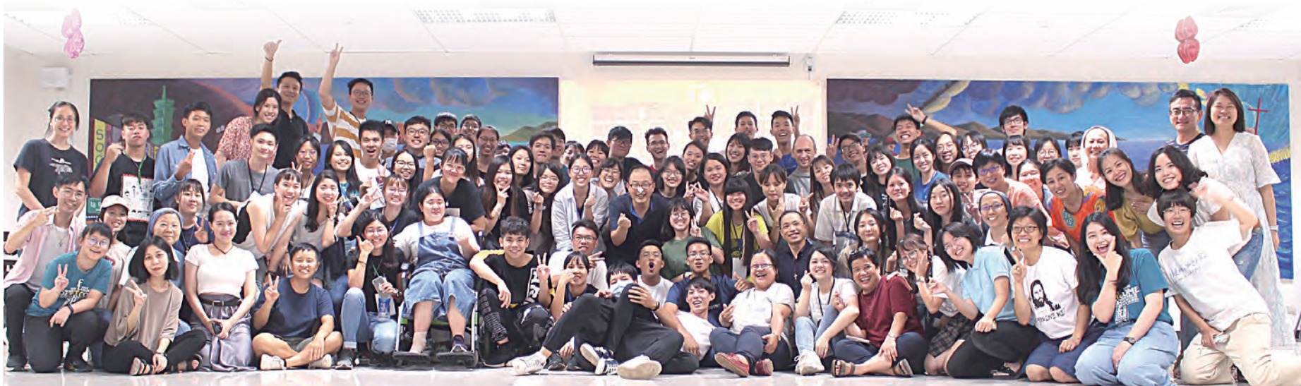
▲陶成營圓滿落幕，但屬於我們獨一無二的派遣才剛開始。