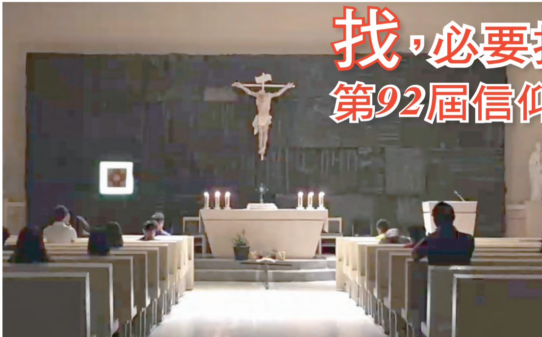
▲跪在聖體前，我們不得不承認我是屬於祢的。