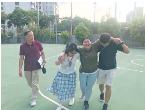
▲夥伴們彼此扶持，讓愛的流動源源不絕。

除了這些客觀的因素外，整個籌備小組（小隊隊輔和輔導）的內心動態，也使得第92屆陶成營成為了不只是培訓教會內青年的暑期活動，更成了教會青年向外福傳的契機。首先，在課程的表達中注入強烈的藝術元素來回應時下年輕人的訴求，靜態的課堂模式不容易與被授者產生直接的心靈交流，也不容易為非天主教的朋友所明瞭，但透過肢體的表達、旋律的躍動、話劇的張力，交織成了一次恩寵滿溢的信仰盛宴。在這個豐盛的領受中，天主與人直接溝通，不是膚淺的邂逅，而是深度的建立友誼。