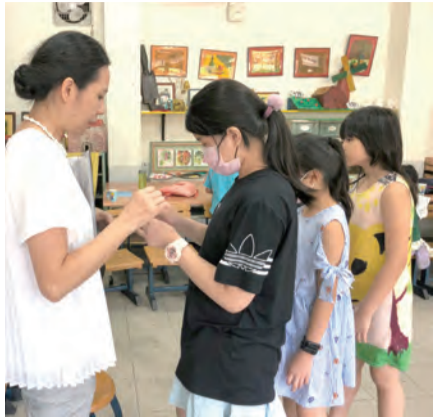
▲主日學課程活動中，老師先與孩童交換心得，達到教學的效果。