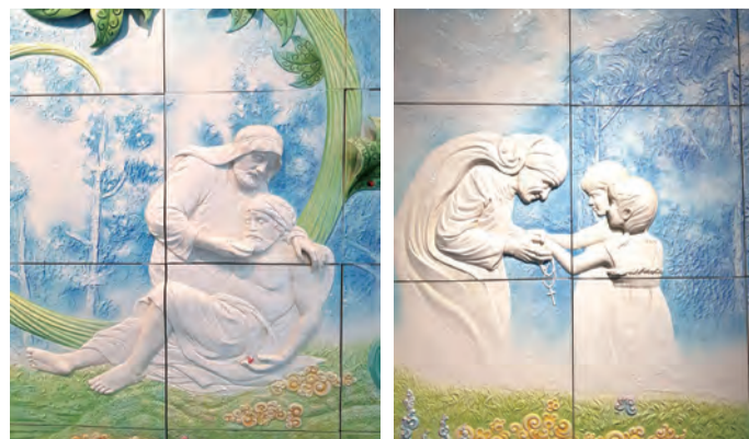
▲▲輔大醫院大廳瓷藝壁畫呈現善良的撒瑪黎雅人與聖德蘭姆媽的愛

面臨精算的資源與不可測的未來，《聖經》中門徒斐理伯理性的回應，從古至今，都代表了大部分人的眼光：「就是二百塊『德納』的餅，也不夠每人分得一小塊」（若6：7）的確，當試煉來臨時，自由的抉擇呈現出最寶貴的空間，然而，藉著心中所懷希望的理由時，