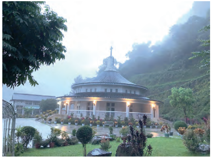
▲華燈初上的聖堂外景，讓人沈澱身心。

人生匆匆一甲子！即將邁入耳順之年的我，想著該如何送自己一份生日禮物呢？物質堆疊似已毫無意義，心底油然湧湧渴望的是：我一定要再次奔赴聖母山莊，向我摯愛的聖母媽媽歌頌讚美；在這8月15日聖母蒙召升天的慶節，在此分享攀登礁溪五峰旗聖母山莊的無限美好豐盈收穫。