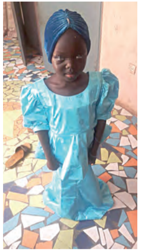
▲塞內加爾的小妹妹，感受到台灣人的愛與溫暖。