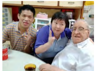
▲愛的連結，從陽明山永福到新莊頤福園，我們關心神父爺爺們！

在歡樂歌詠時段裡，永福天使們獻唱〈我最愛的祢〉、〈雲上太陽〉、〈讚美之泉〉、〈小蘋果〉、〈你是我的花朵〉，天使們牽著神父爺爺的手打拍子、隨律動搖擺、獻上手作祝福之花、伸出雙手釋出善意的擁抱。其中有位院生很久沒有返家，十分想念父親，透過這次關懷之旅，接收到來自神父爺爺們滿滿的父愛，臉上寫著愉悅滿足。神父們看到院生十分開心，也使用各種打擊樂器隨著節奏一起互動；當收到一朵朵彩色的乳香祝福之花時，更是十分驚訝歡喜。