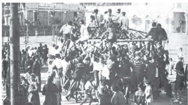
▲二戰時，羅馬慈幼中學校內活動的實況。