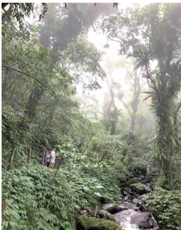
▲攀登聖母山莊的路，很像葡萄牙靈性之路。

上山容易下山難，好幾處階梯都是大石頭又高又滑，我總停下來用心思考如何下足；自己雙腿無力，又擋著後面的下山者。畢竟和我同行的好姊妹年齡狀態與我相似，幸好瞬間有位年輕女登山客，本請我先讓她下，而後，她扶著我下階梯，到後來，她還是不放心我天雨路滑，她就好心一路扶我下每一個階梯，並鼓