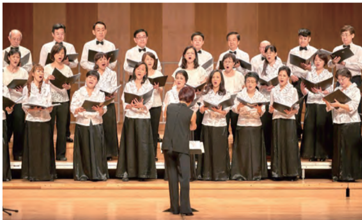
▲佳播聖詠團的愛樂夥伴天主教志工合唱團也參與此次年度公演。

今年9月4日的佳播音樂會，佳播將透過音樂、藉由共融，讓我們擁抱每一顆受傷的心靈！音樂會的節目內容多元：從聖樂、踩踏到福音歌曲；從古典、撥弄到流行；從非洲大地向天父投以原始般高更色調的熱情、迴影到島