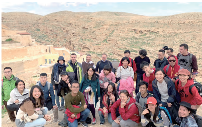
▲走過以色列的曠野，讓大博爾青年更體悟信仰的珍貴。