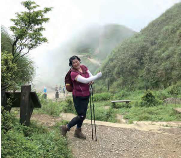
▲在全心交託之後，一切辛苦化為甘甜。