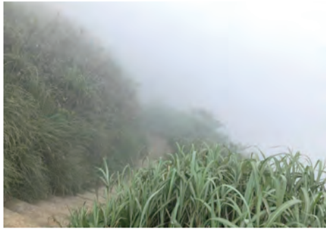
▲山頂風景如畫，是靈修好去處。