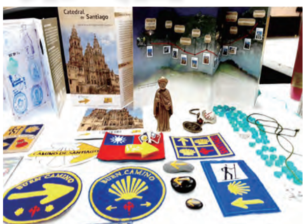
▲研討會現場展示朝聖者帶回的紀念品，滿滿美好回憶。