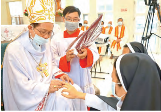
▲鍾安住總主教親自為兩位宣發永願修女戴上代表永生君王的「淨配之戒」。