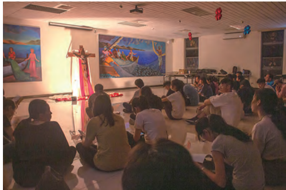
▲祈禱讓我們回到自我與天主的關係中

營隊中，我們彼此分享，因為信任，我們毫無保留，從別人的分享中，學習自己所不足的；從互相的鼓勵安慰中，找到被愛的感覺。在生活中也許因為遇到挫折困難而懷疑天主