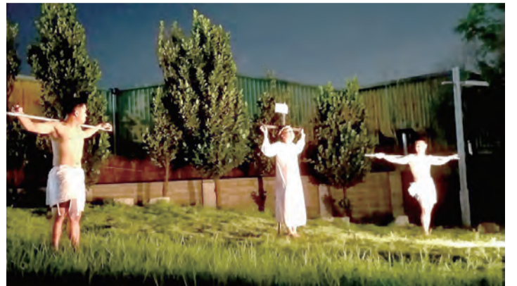
▲真人苦路中，逾越奧蹟的愛情再次觸動我們的心。

歷經疫情漫長的等待後，第92屆信仰陶成營終於在今年7月12至17日順利舉行。近1年的準備和共融，我們走過延期的失望、疫情變動的焦慮，一路上卻也在主愛的恩寵中，越走越堅定、越走越平安。