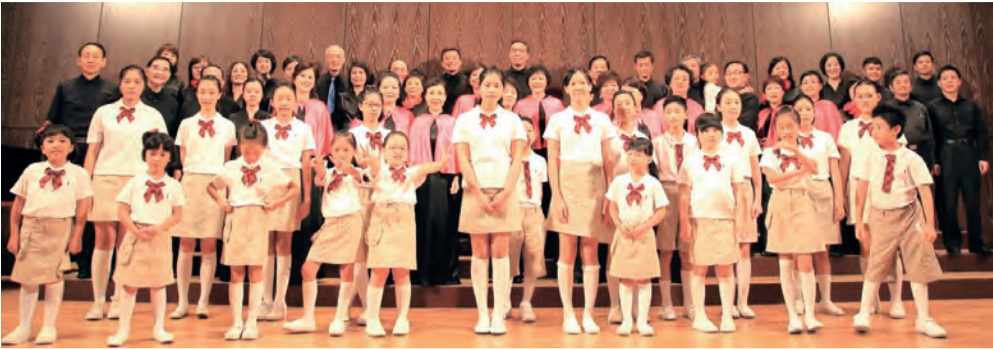
▲這些年來，佳播聖詠團與鮑思高兒童合唱團的合作演出，讓人留下驚喜驚嘆的深刻印象。 ▶佳播聖詠團精心策畫每一次的年度公演，在聽覺上予人舒暢享受，連視覺細節也都注重。