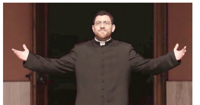
▲Tv2000it的專題報導，顯現慈幼會士的愛。