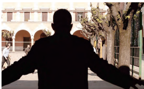
▲電影《做你的護衛》完整道出鮮為人知的英勇故事

這些慈幼會的神父們懂得——愛並非緊閉大門，反而，最能展現愛的方式，是張開雙臂，敞開大門。