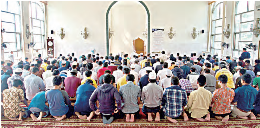
▲台北穆斯林朋友同心祈禱，幫助來自塞內加爾的病人早日康復。